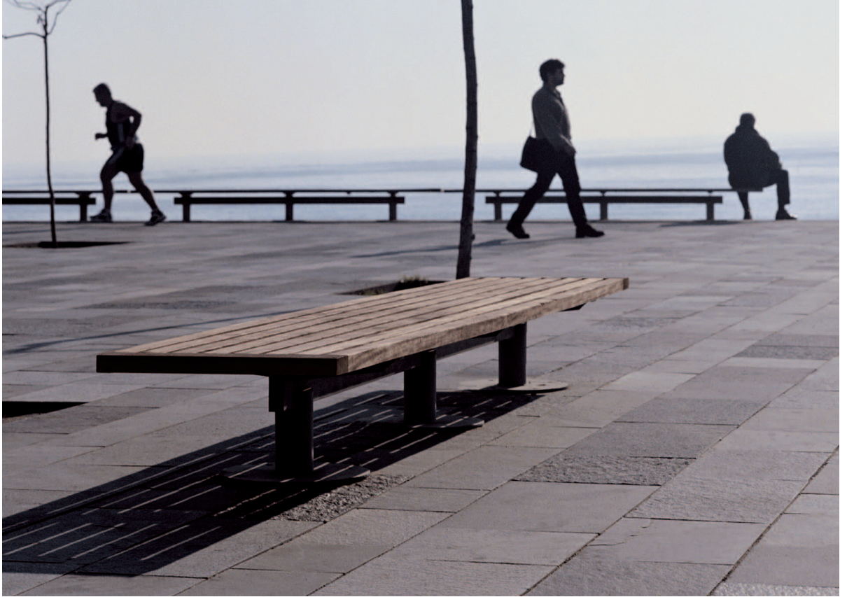
Paseo Marítimo de la Barceloneta, Barcelona (Spain)