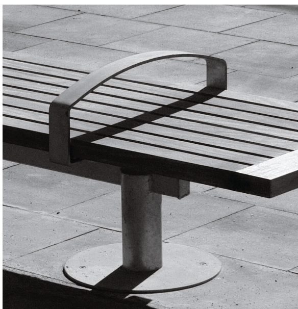
Paseo Marítimo de la Barceloneta, Barcelona (Spain)

Todos los modelos pueden incorporar brazos.